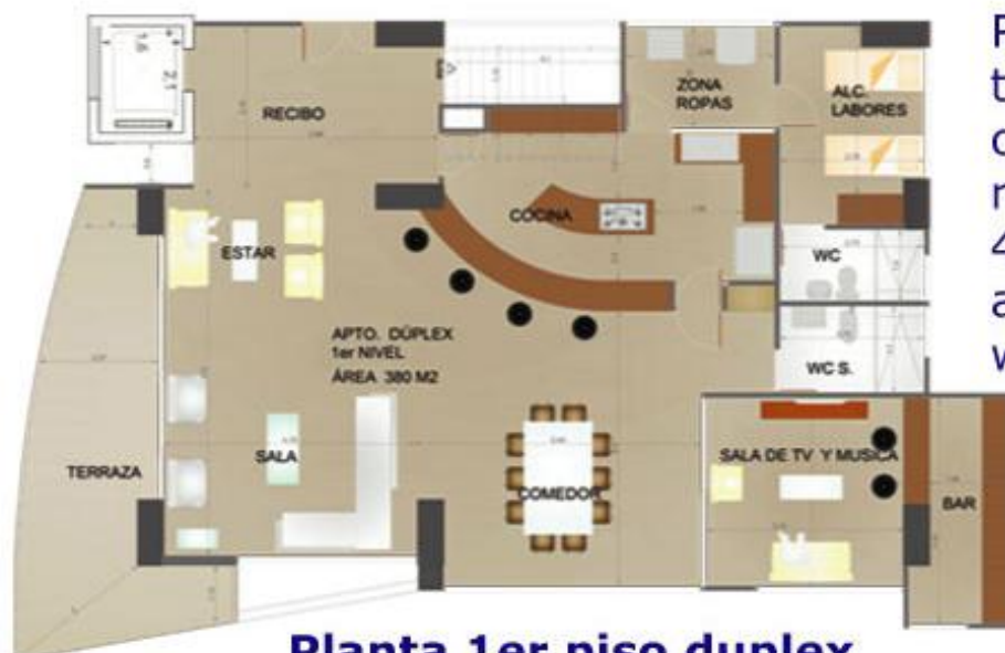
Planta 1er piso duplex