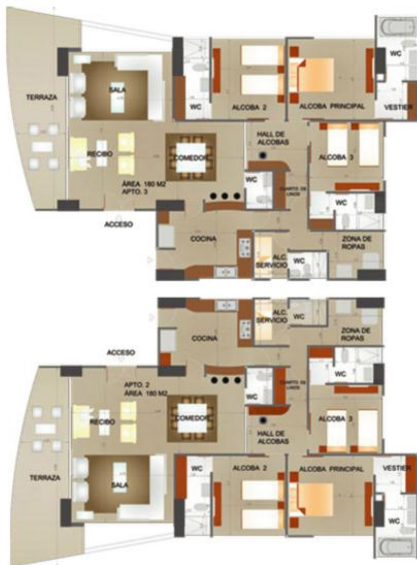
Planta arquitectonica piso tipo

Recibo, sala, comedor, cuarto de linos, cocina, zona de ropas, hall de alcobas, 3 alcobas + wc + vestier, alcoba del servicio + baño, wc social terraza.