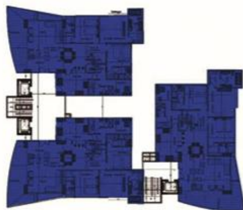
Planta piso tipo duplex

Recibo, estar, sala, sala de tv, musica y bar, estudio, comedor, cocina, zona de ropas, hall de alcobas, 4 alcobas + wc + vestier, alcoba del servicio + baño, wc social, 2 terrazas.