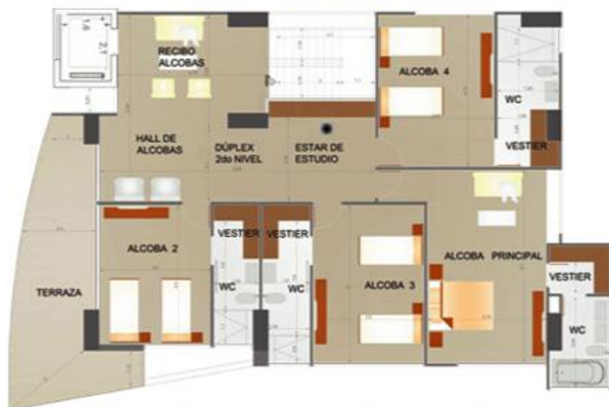
Planta 2do piso duplex

Recibo, estar, sala, sala de tv, musica y bar, estudio, comedor, cocina, zona de ropas, hall de alcobas, 4 alcobas + wc + vestier, alcoba del servicio + baño, wc social, 2 terrazas.