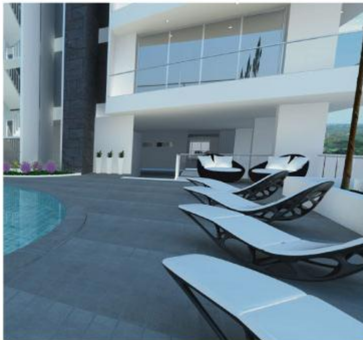
PISCINA, SOLARIUM, VISTA PANORAMICA, SALON SOCIAL, GIMNASIO, ZONAS VERDES, PARQUE PEATONAL ACCESO AL RIO SINÚ